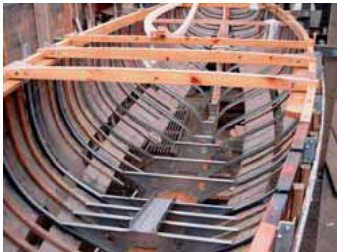
Bådens grundlæggende konstruktion med stålsplanter og de første dæksbjælker. Jan. 2003

nal. Overlevet har en del svøb, dele af bjælkevægerne, spant nr. 3, en dæksbjælke, den centrale del af trækølen samt masten, der dog ikke er fra 1922. Klædningen af hondurasmahogni kunne ikke reddes – den er derfor ny (men den er af hondurasmahogni!) Det 2. spørgsmål igennem årene har været: Var det ikke lettere/billigere/smartere at bygge en ny båd? Svaret har altid været, at så ville det jo ikke være Oui Oui! Bådens sjæl er jo bevaret trods den gennemgribende restaurering og bådens facon ligeså. Spørgsmål 3: Hvornår er den færdig? Vi har altid svaret, at det er den, når vi er færdige med arbejdet. Men nu kan vi sige det mere præcist: