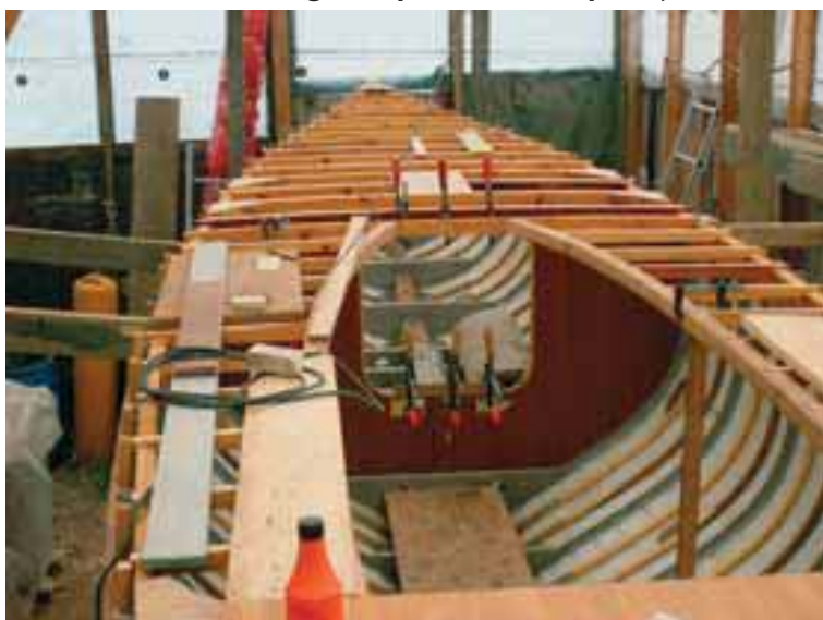
Skottet ved masten og cockpitkarmen er på vej i 2006

behandles rigtigt og professionelt – og helst uden skader, så derfor går vi lidt forsigtigt frem. Det er også vigtigt for gruppen at båden sejles, bruges og viser K.A.S.-standeren ved kapsejladstævner rundt om i landet og i det nære udland – om den vinder sølvtøj må tiden så vise. Uanset hvad, så er der mulighed for alle interesserede medlemmer for at komme ud at sejle i den mest klassiske kapsejladsbådtype, nemlig 6mR. Hvilken anden klub end K.A.S. har sådan et tilbud til sine medlemmer?