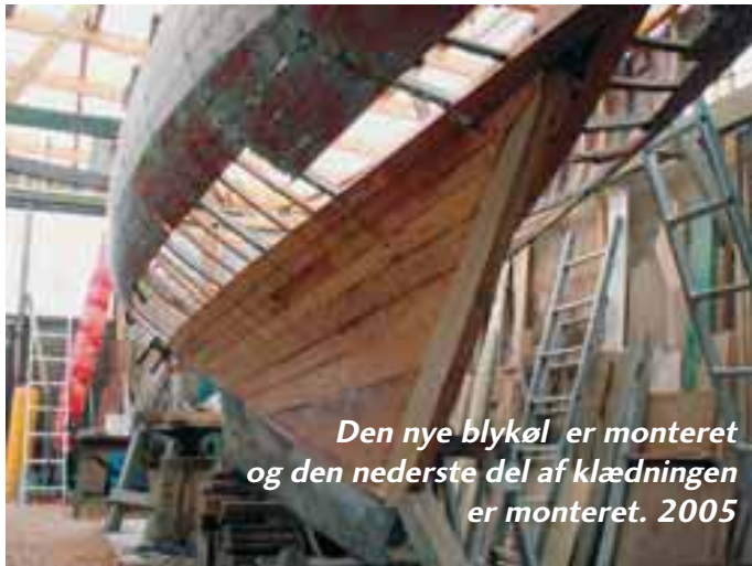
Den nye blykøl er monteret og den nederste del af klædningen er monteret. 2005