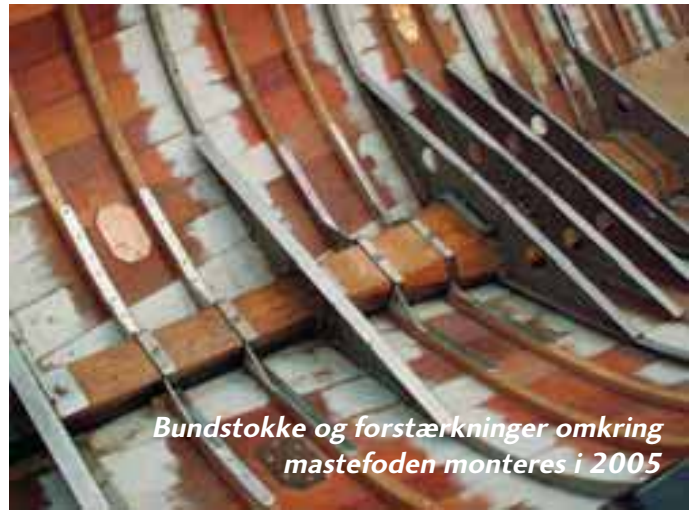
Bundstokke og forstærkninger omkring mastefoden monteres i 2005