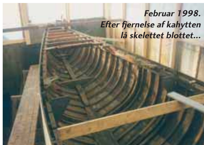
Februar 1998. Efter fjernelse af kahytten lå skelettet blottet...