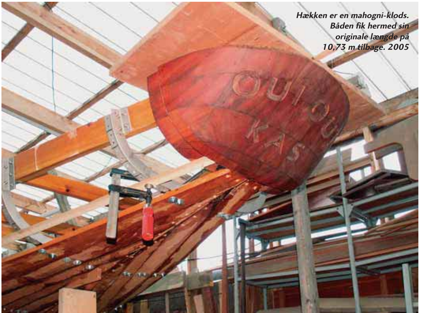
Hækken er en mahogni-klods. Båden fik hermed sin originale længde på 10,73 m tilbage. 2005

Oui Oui skal som lovet i 1997 være en ganske speciel klubbåd. Dvs. den er ikke en skolebåd, den er heller ikke en båd for en indspist skare af medlemmer, der holder andre ude, nej båden skal principielt være en båd for alle klubbens medlemmer – under visse betingelser: man skal have mod på og lyst til at sejle kapsejladts – ikke frokostsejladts. Man skal have visse grundlæggende færdigheder – en duelighedsprøve er minimumskravet. Skipperne på Oui Oui vil i den første tid være fra gruppen omkring bådens restaurering samt et par andre – men så hurtigt som muligt vil vi arbejde på at sprede ansvaret ud på mange flere. Det er vigtigt at båden