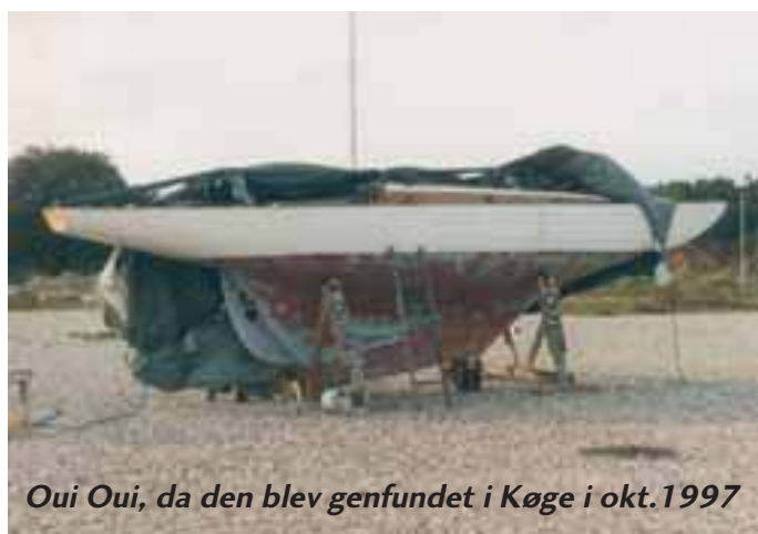
Oui Oui, da den blev genfundet i Køge i okt.1997