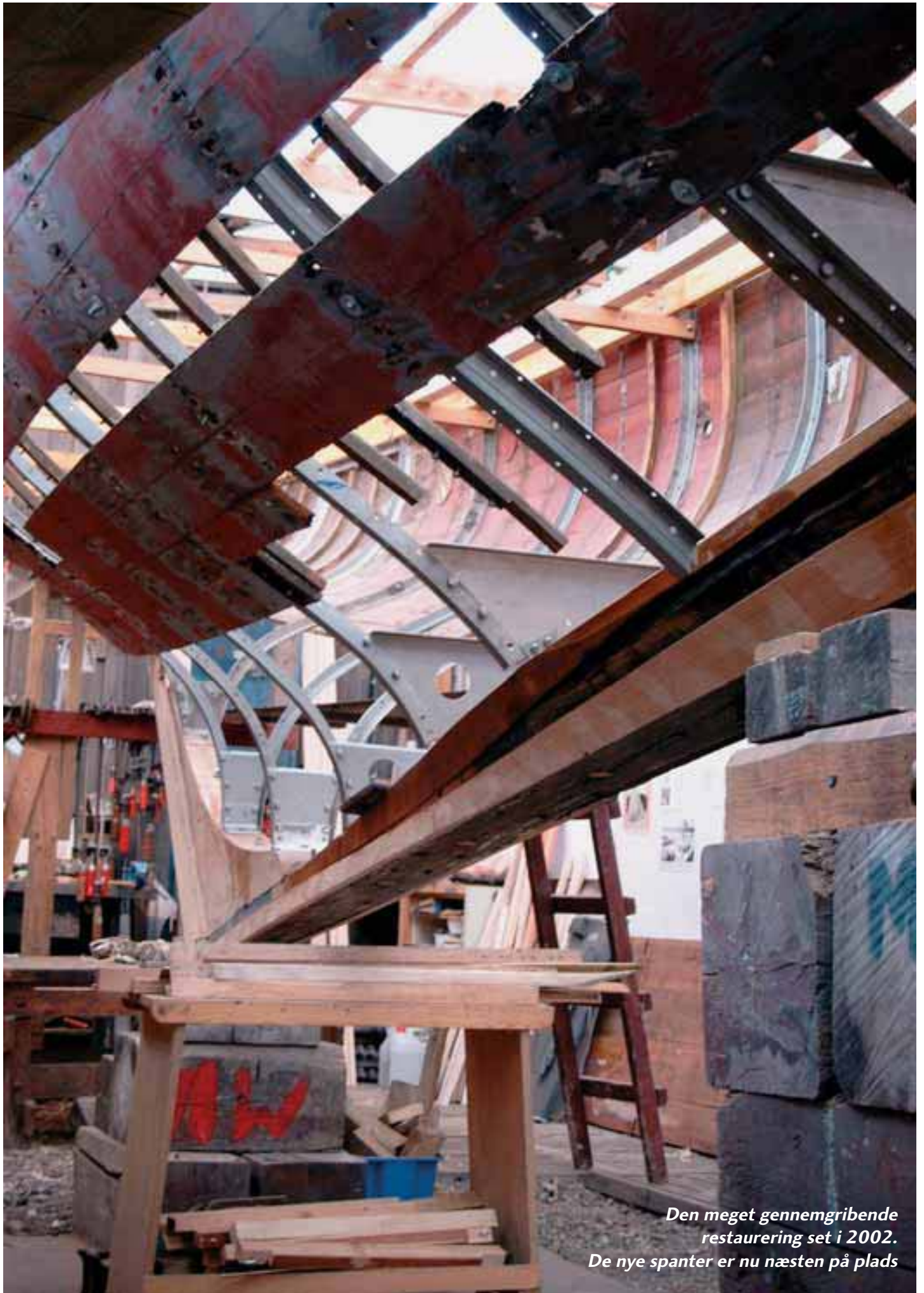
Den meget gennemgribende restaurering set i 2002. De nye spanter er nu næsten på plads